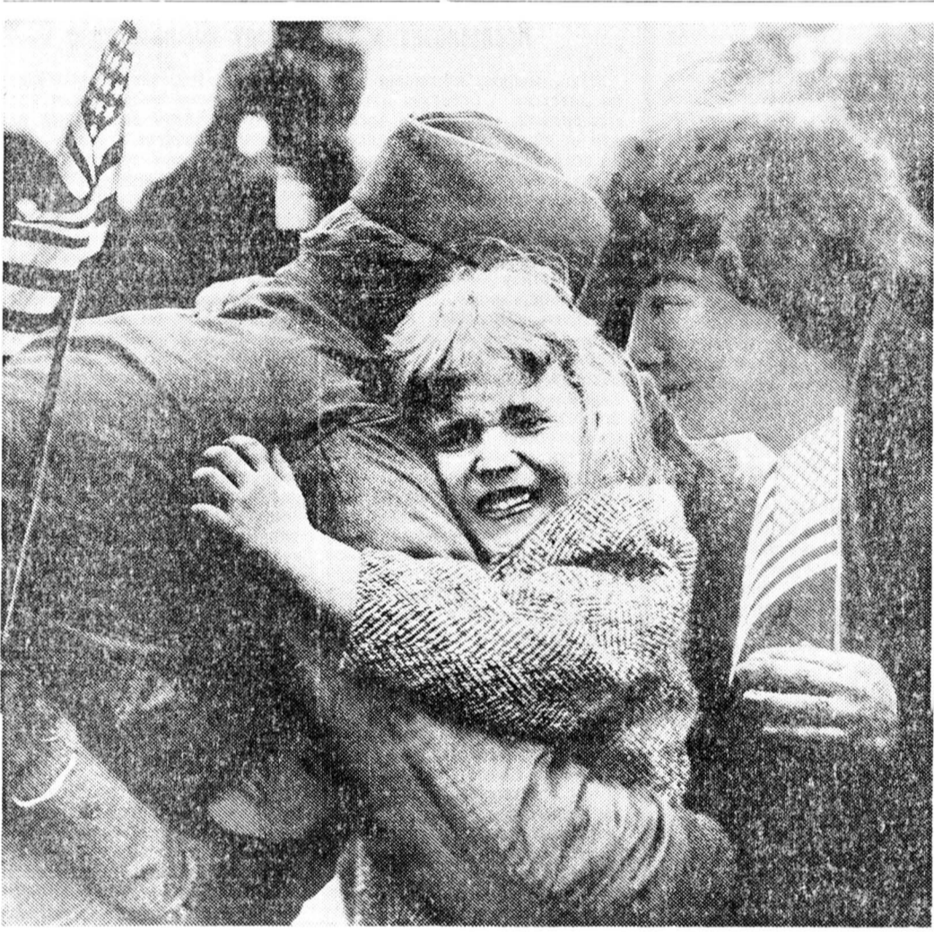
Этот снимок мы получили несколько дней назад. Он опубликован в номере журнала «Ньюсуик», датированном 18 марта. Первые американские солдаты возвращаются из Персидского залива домой. Америка встречает своих сыновей.