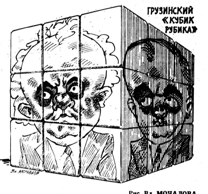
Рис. Вл. МОЧАЛОВА.