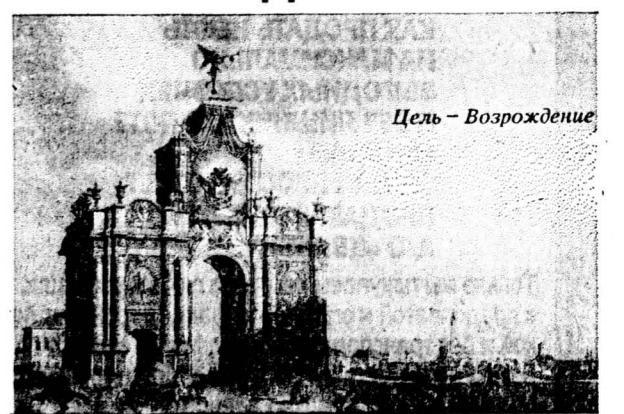
Цель — Возрождение

предлагает сотрудничество юридическим и частным лицам по вопросам организации и проведения конкурсных торгов и аукционов по продаже недвижимости.