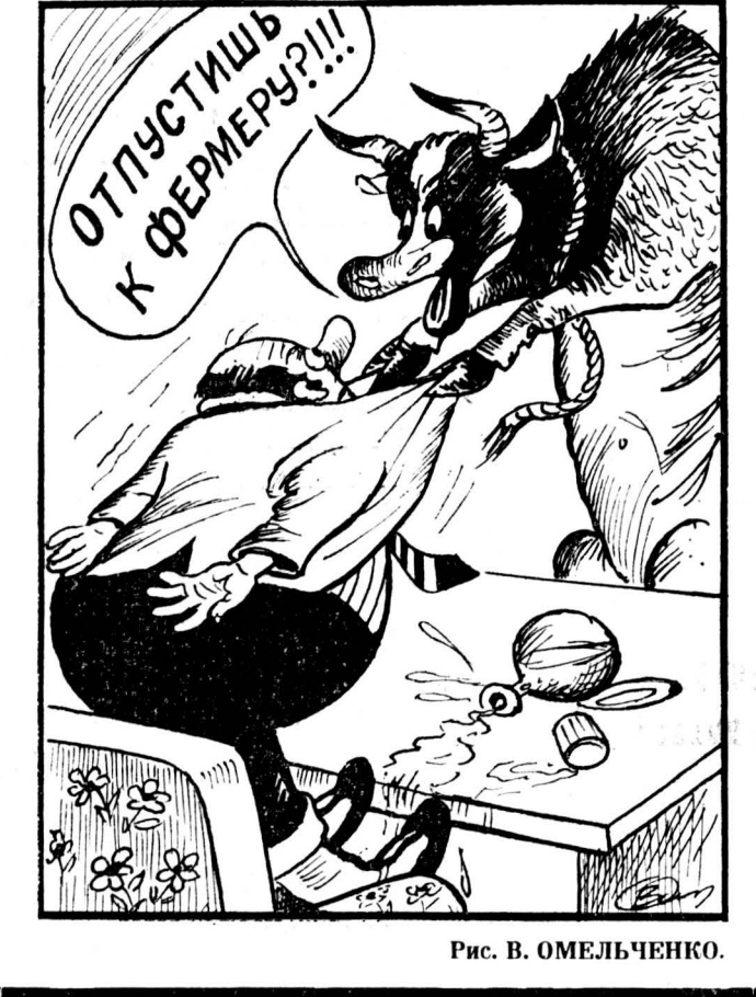
Рис. В. ОМЕЛЬЧЕНКО.