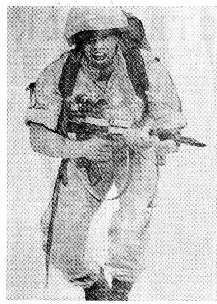
Английский солдат из состава коалиционных войск идет в атаку.

На пресс-конференции, проведенной в столице Саудовской