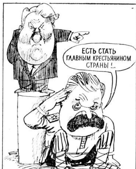
Рис. В. МОУЧАНОВА и Ю. КОСОВУКИНА.