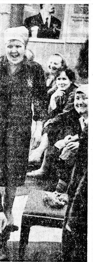
Дефицит товаров отнюдь не означает дефицита счастья. Иллюстрация тому — событие в сборочном цехе инвесского завода «Металлист».

отвечает по положению, при котором функции политического, административного и военного руководства слиты в одной структуре; когда Вооруженные Силы фактически подчиняются только главнокомандующему.