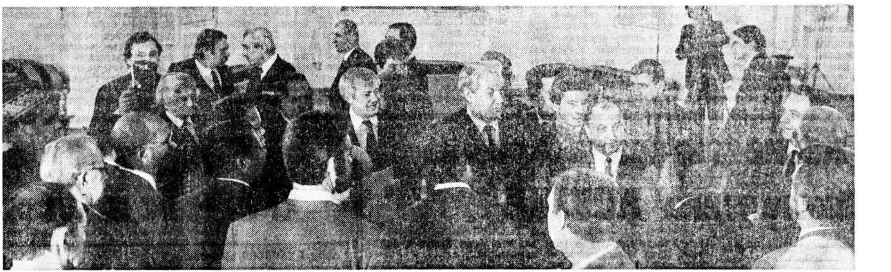
Во вторник в Кремле Президент России Борис Ельцин принял глав дипломатических миссий, аккредитованных в Москве.