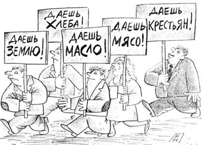
Рис. В. ПОРОХНИ.