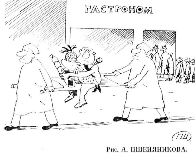
Рис. А. ПШЕНЯНИКОВА.

Соединенные Штаты намерены предоставить Турции 82 миллиона долларов в качестве экстренной военной помощи. Турция — единственная страна НАТО, имеющая общую границу с Ираком. С военновоздушными базами на ее территории взлетают американские бомбелеты, осуществляющие бомбежки объектов в Ираке.