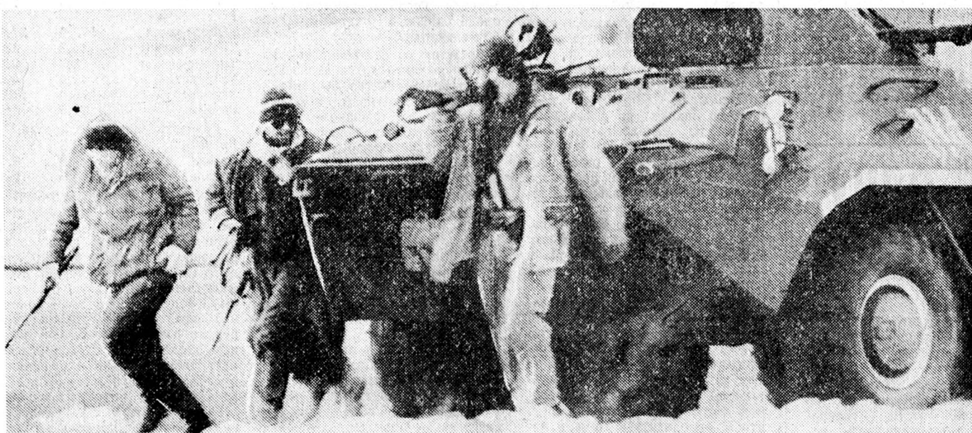
Подразделение «Мхедриони» временного правительства в районе города Абаша.