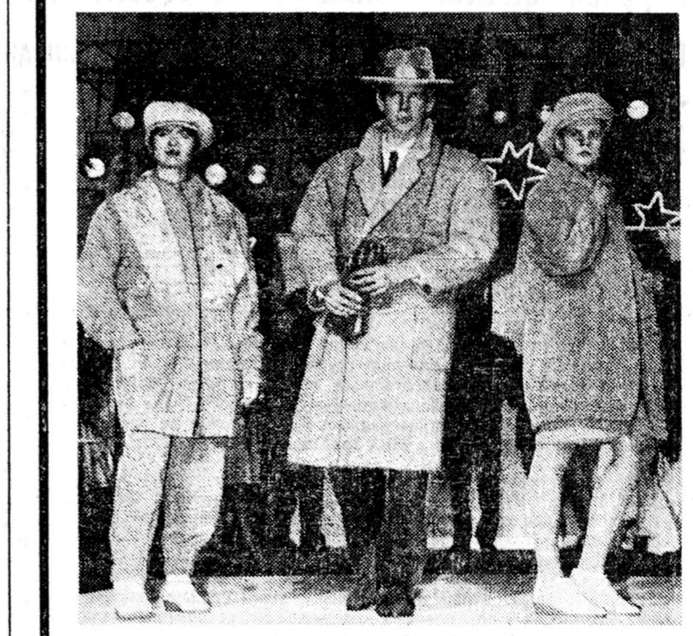
На этом снимке — модели одежды для олимпийцев нашей объединенной команды, которая выступит на Зимних Играх в Альбервиле. Изготовлены они югославской фирмой «Гом», с которой заключил контракт Олимпийский комитет, объединяющий НОКИ государств Содружества.