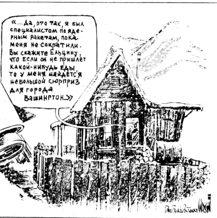
Рис. из газеты «Интернэшнл геральд трибюн».

— Я считаю, что это был бы протипаном полный ликвидация ядерного оружия, во всяком случае на обо-