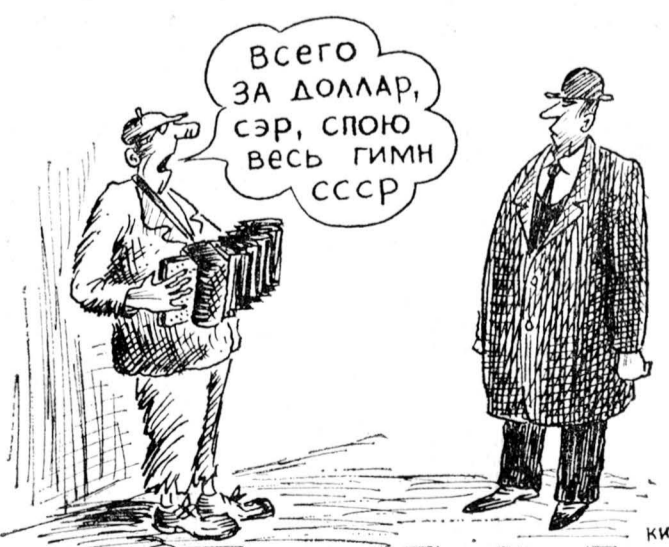
Рис. Н. КИЧАРОВА.