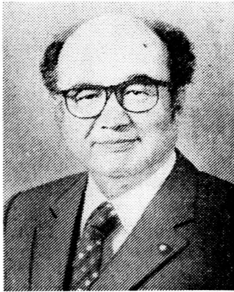
Т. Накаяма родился 27 августа 1924 года в префектуре Осака.

21 января в Москву с официальным визитом прибывает министр иностранных дел Японии Таро Накаяма.