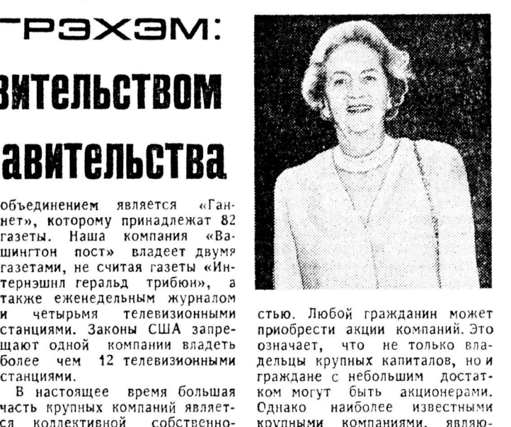
Кэтрин Грэхэм: Если выбирать между правительством без газет и газетами без правительства

пресса Соединенных Штатов весьма значительно отличается от прессы Советского Союза. Количество средств массовой информации в США, имеющих общенациональное значение, невелико: несколько газет, четыре телевизионные сети, включая Си-эн-эч, хорошо знакомую москвичам, и три журнала («Журналы в США значительно больше, но только три из них освещают события, представляющие всеобщий интерес). Позволяющая часть средств