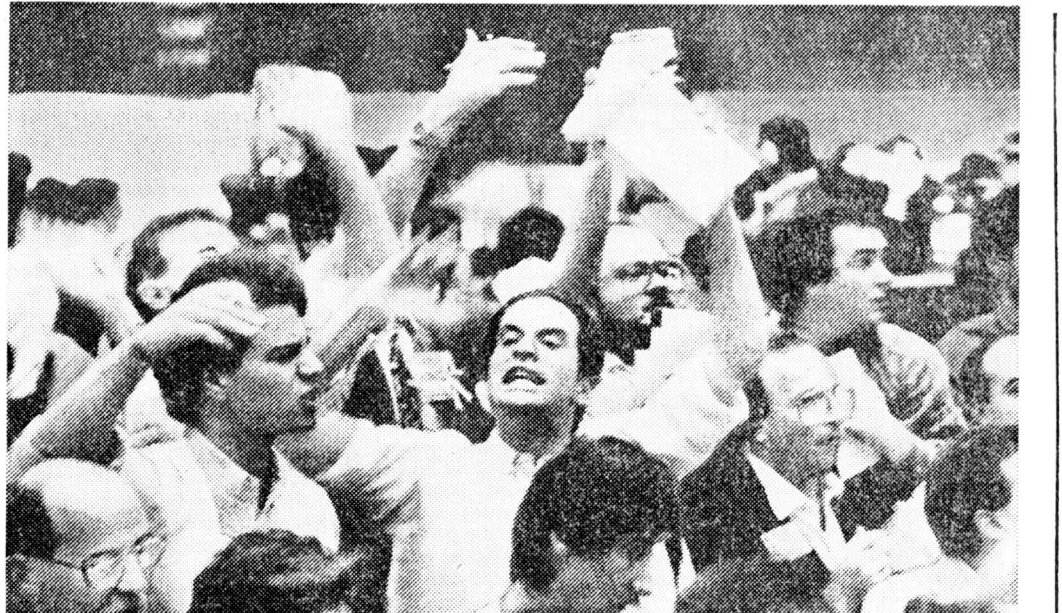
На снимке: «жарко» на нью-йоркской бирже.

Таких мер безопасности, как сейчас, Египет не предпринимал внутри страны со времен убийства исламскими фундаменталистами президента Анвара Садата.