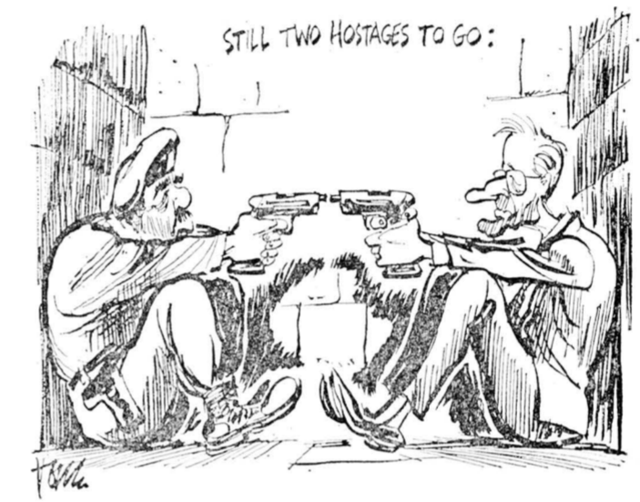
«Осталось еще два заложника».