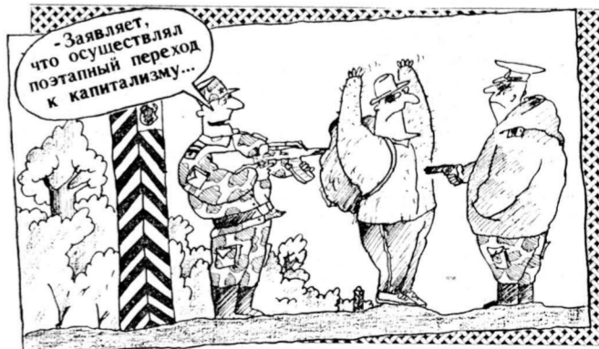
Рис. В. ШИЛОВА.

Собравшиеся в Москве руководители национальных олимпийских комитетов (НОК) Армении, Беларуси, Казахстана, Кыргызстана, Молдовы, России, Украины, представитель олимпийского движения Азербайджана, а также руководители НОК бывшего СССР решили создать на переходный период, до получения признания Международным олимпийским комитетом национальных олимпийских комитетов независимых государств, общественный орган — Совет президентов национальных олимпийских комитетов.