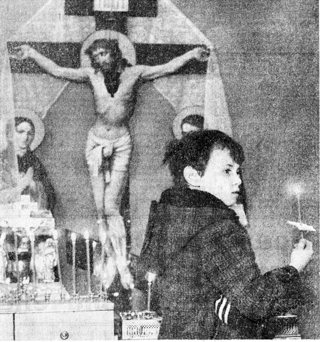
Сергей МОСТОВЩИКОВ, «Известия»