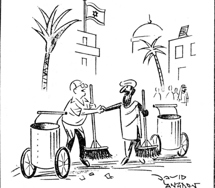
«Физик-ядерщик из России...» «Еврей-фалаш из Эфиопии, христианин...» Рисунок из лондонского еженедельника «Панч».