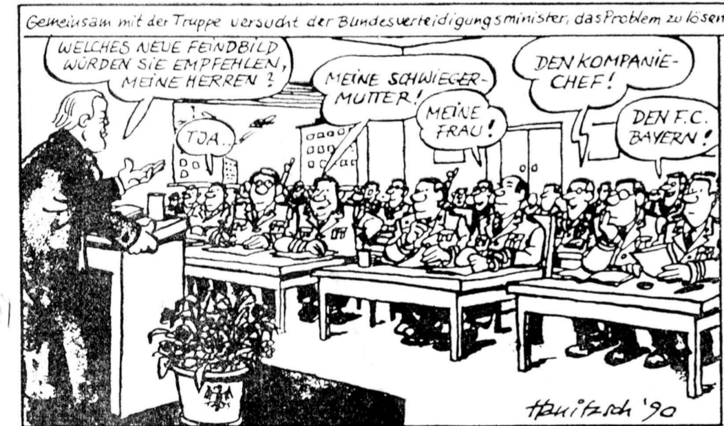
Голоса с мест: — Моя тесть! — Моя жена! — Командир полка! — Футбольный клуб «Бавария».

Ю. КОВАЛЕНКО, соб. корр. «Известий», ПАРИЖ.