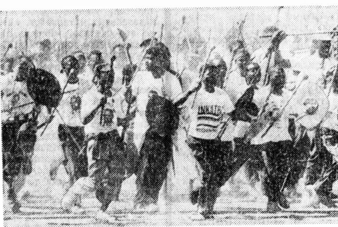
раздаются призывы к расследованию...