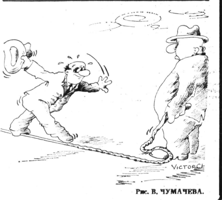
Рис. В. ЧУМАЧЕВА.