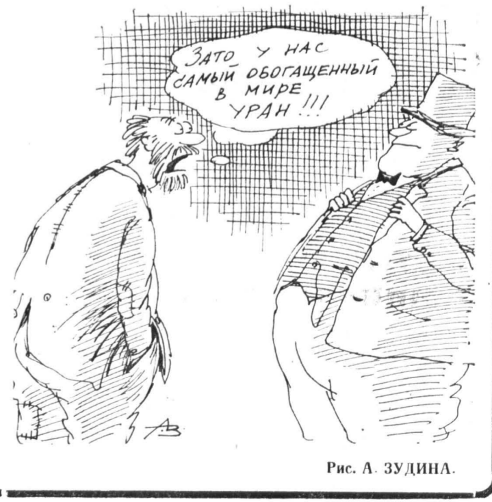
Рис. А. ЗУДИНА.