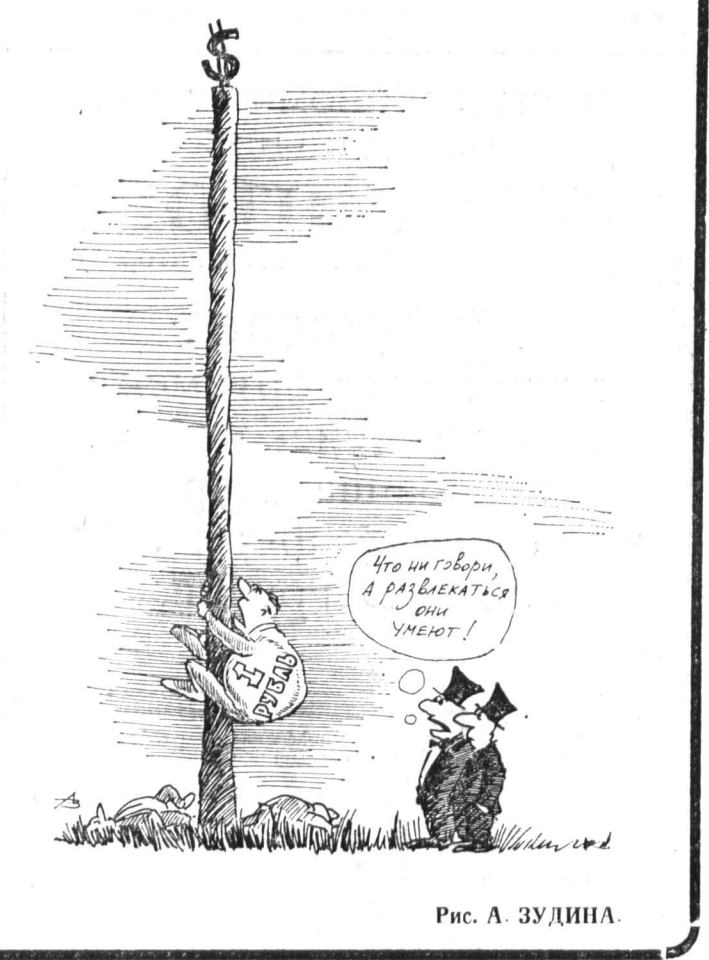
Рис. А. ЗУДИНА.

Первый авиакосмический салон обещает стать крупнейшим в мире в 1993 году. Салон пройдет на трех площадках — самом большом в Европе аэродроме в Жуковском, летном поле на Ходынке (почти в центре Москвы) и выставочном павильоне на Красной Пресне. Сергей ЛЕСКОВ, «Известия».