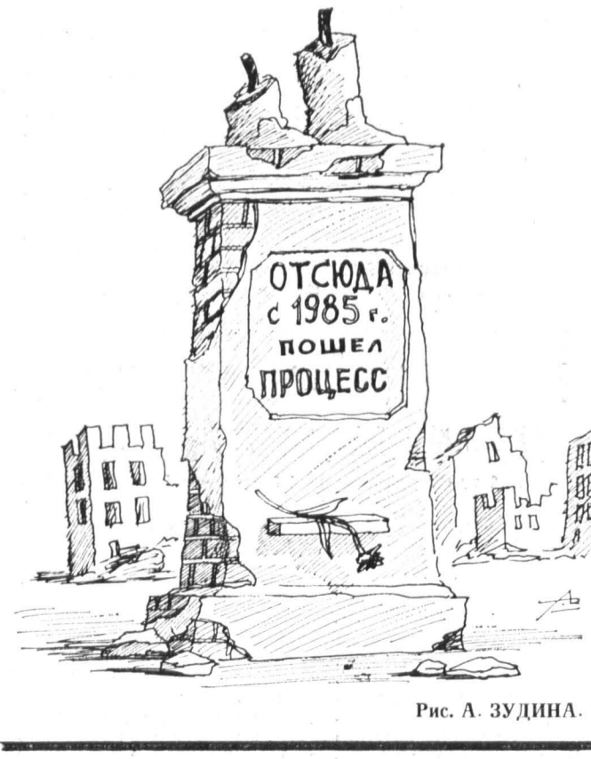
Рис. А. ЗУДИНА.