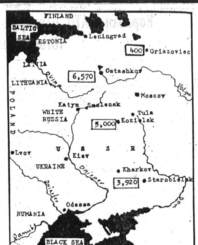
Карта из книги «Катынский лес», изданной в Лондоне в 1988 году. На ней изображены основные лагеря в европейской части Советского Союза, в которых в 1939-1940 годах содержались польские военнослужащие.