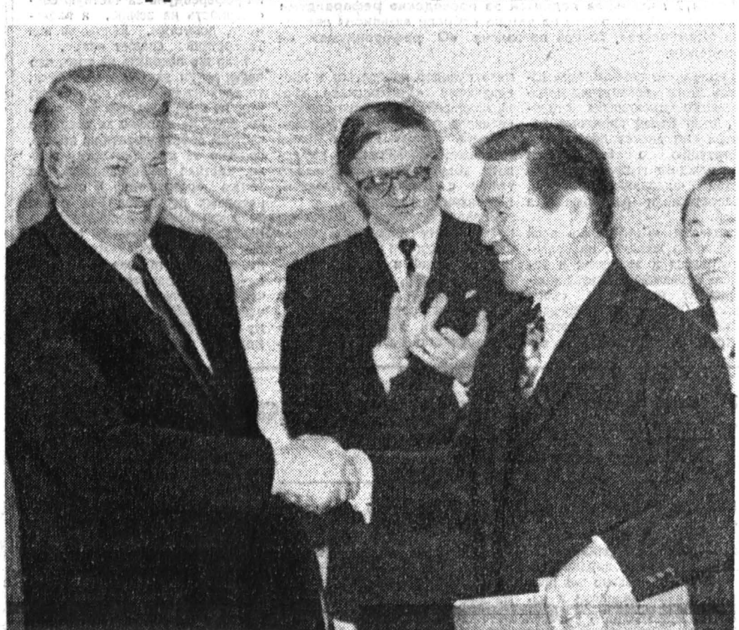
После подписания документов.