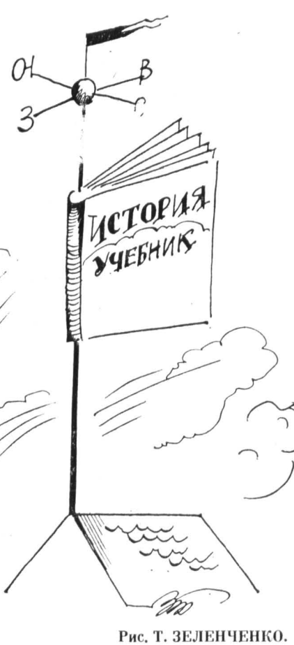
Рис. Т. ЗЕЛЕНЧЕНКО.

17.220.900 рублей — такой суперприз причитается лишь одному из всех участников лотто «Миллионы», который в третьем коммерческом тираже «Олимпийской лотереи» угадал 6 цифр из 49. Но когда контрольная комиссия компании решила проверить подлинность билета, то выяснилось, что счастливым получателем в кассе почит... 20 миллионов рублей. Рисковый участник играл по развращенной системе, зачеркивая на каждом из трех полей по 13 чисел. В общей сложности он заплатил 51480 рублей. Смелый игрок только на одном из трех полей указал точно шесть счастливых цифр, но и этого было достаточно, чтобы собрать богатый «урожай» призов. В сумме он получил на руки 19.992.690 рублей. Сергей СОКОЛОВ, журналист.