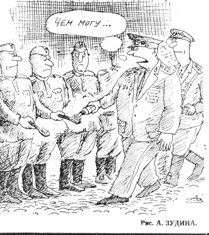
Рис. А. ЗУДИНА.