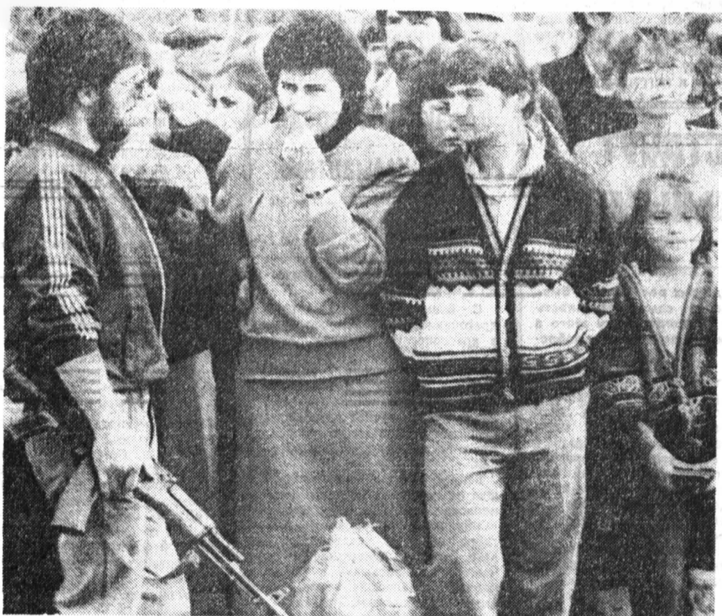
Абхазия. На границе с Россией по реке Псоу — беженцы, желающие пройти на российскую территорию.

Генерал сказал: есть надежда решить проблему мирным путем, но российские войска готовы и к другому варианту развития событий.