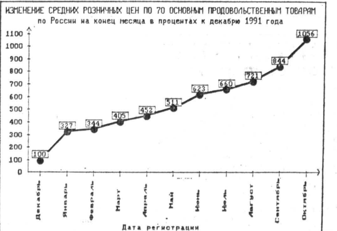
Татьяна БАЛУГИНА, Госкомстат Российской Федерации

На городских рынках цены с 20 по 27 октября выросли на 5,8 процента. В октябре на городских рынках Москвы и Санкт-Петербурга постоянно фиксировались самые высокие в России цены на мясные и молочные продукты, сопоставимые лишь с ценами небольшого числа городов Крайнего Севера и Дальнего Востока. Молоко на городских рынках Москвы 27 октября стоило в среднем 87 рублей. Второе на рынках Москвы продавался по 233 рубля за килограмм, на рынках Санкт-Петербурга — 180 рублей при средней цене на рынках России — 126 рублей.