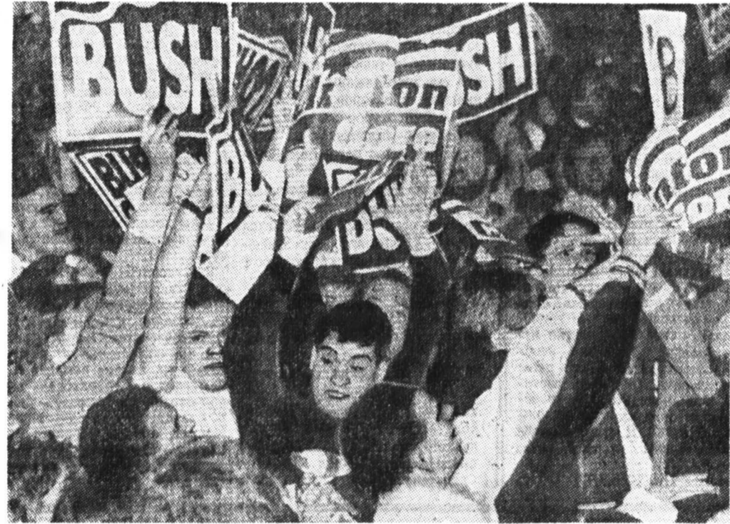
Последние предвыборные баталии в США — сторонники Буша и Клинтон выясняют отношения в штате Огайо.