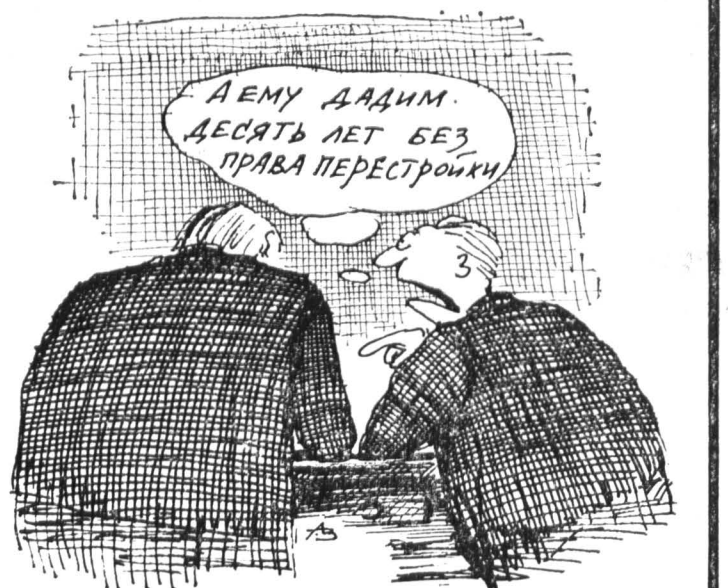
Рис. А. ЗУДИНА.