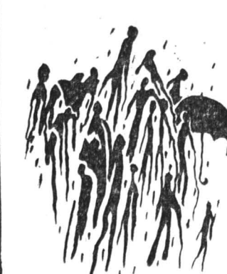
«Дождь». Рисунок победительницы.

ТУРБОХОД «Леонид Собинов» (порт приписки Валлетта, Мальта) 4 октября покинул Одессу и взял курс на Пирей.