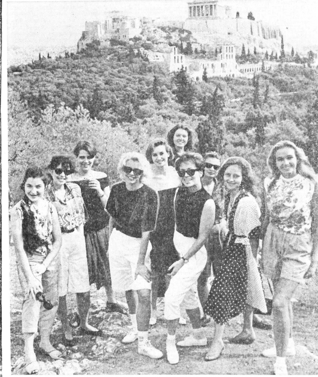
Групповой портрет на фоне Акрополя.