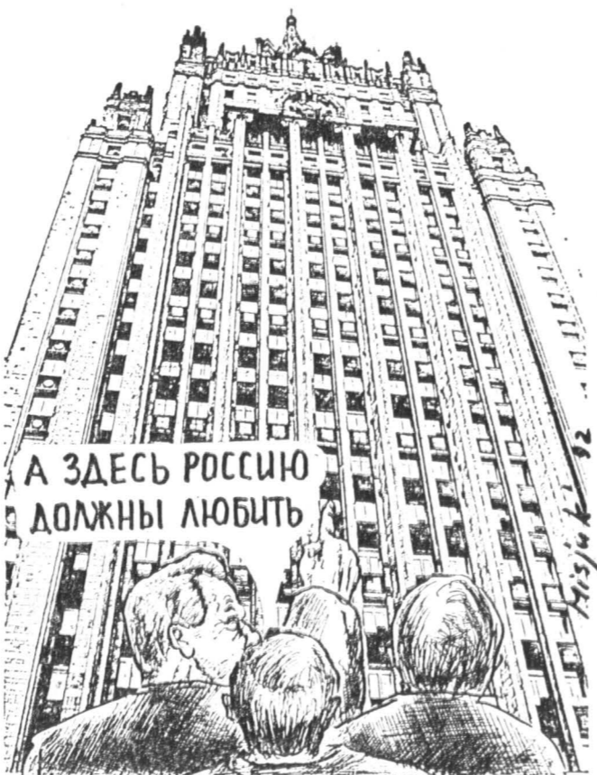
А ЗДЕСЬ РОССИЮ ДОЛЖНЫ ЛЮБИТЬ