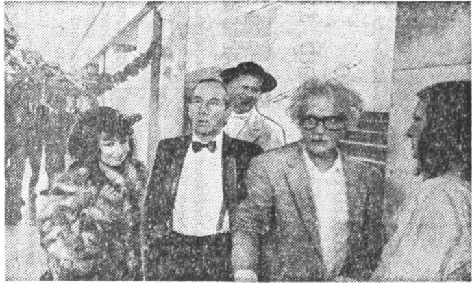
Георгий Данелия на съемках фильма «Белый танец».

Сейчас Данелия завершает работу над новым фильмом «Белый танец» (студия «Ритм» киноконцерна «Мосфильм»). 62-летний классик, как обычно, собрал представительную команду, состоящую из асов: авторы сценария Александр Адабашьян и Александр Володин, оператор Павел Лебешев, композитор Андрей Петров; актеры Евгений Леонов, Александр Абдулов, Са-