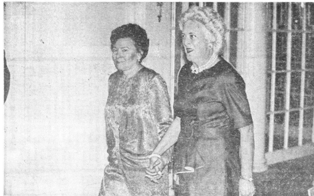
Наша Ельцина и Барбара Буш.

Опыт феминистского прочтения одного интервью