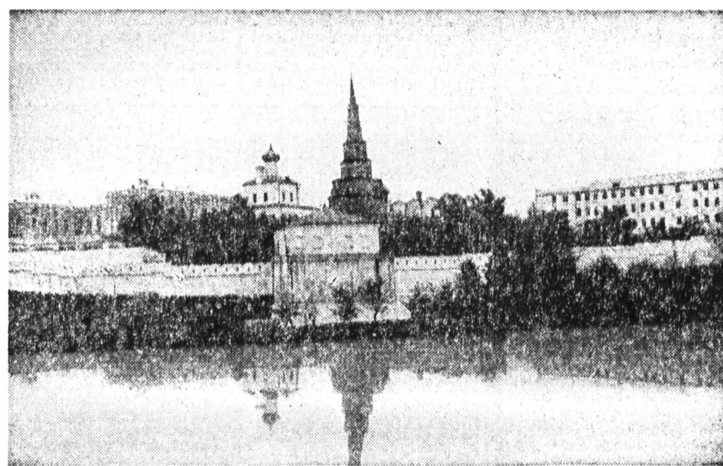
Казанский кремль. Октябрь 1992 года.

Помешала внутриказанские династические распри, интриги со стороны Крима и других «друзей» Золотой Орды. В итоге между Москвой и Казанью сложились достаточно напряженные