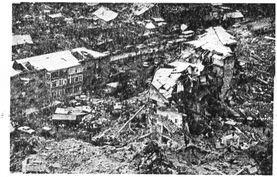
Материальный ущерб достигает 40 миллиардов долларов в год.

оружения в местах частого схода селей. Жертвами же лавин становятся, как правило, «одичавшие» туристы, пренебрегающие рекомендациями метеорологов и путешествующие без проводника, сами провоцирующие сход лавин.