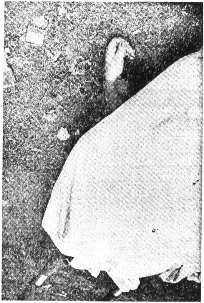
В результате стихийных бедствий ежегодно гибнет 250 тысяч человек.

предупреждению гидрометеослужбы удалось максимально сократить число погибших, однако Причорский край понес огромный ущерб, достигавший 500 млн. руб.