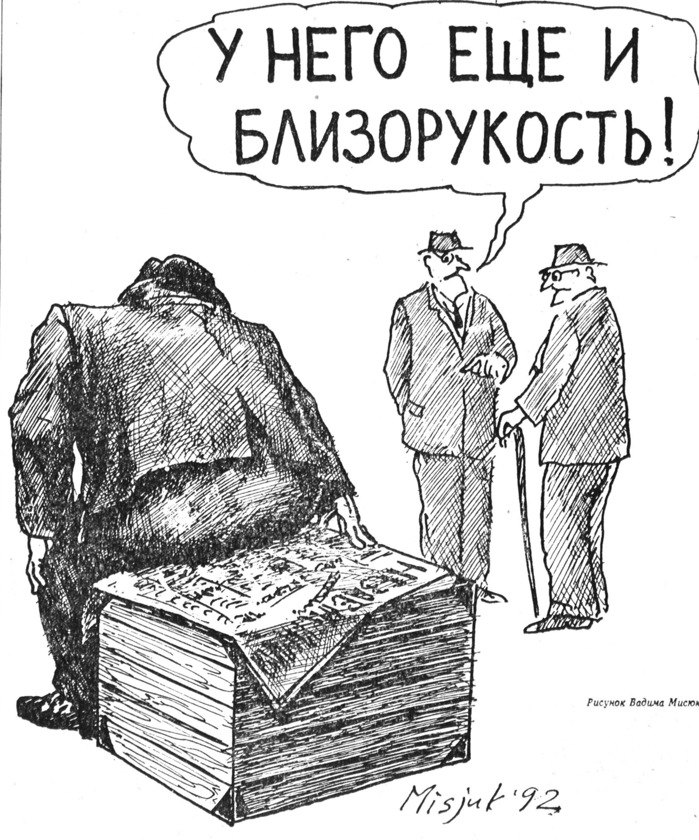
Рисунок Вадима Мисюка