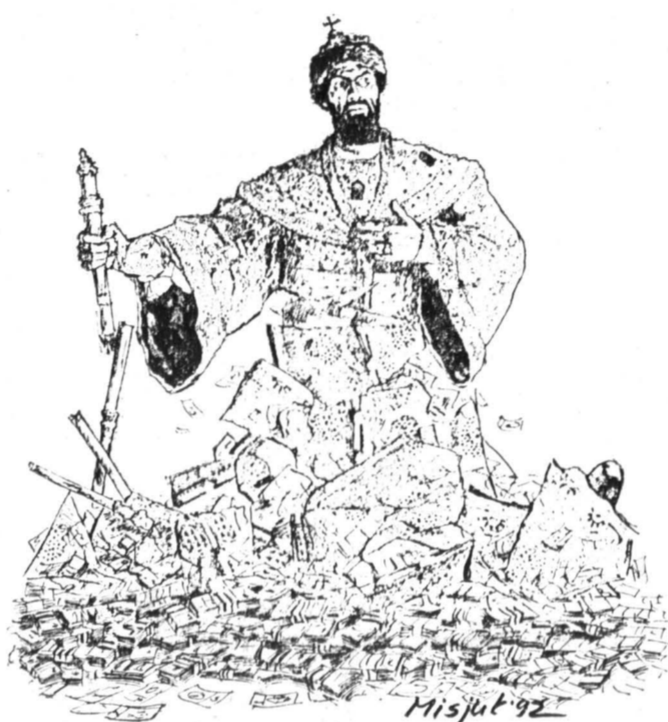
Рисунок Вадима Мисока.

Вице-премьер Грузии Ротан Гоциридзе сказал, что у его рес-