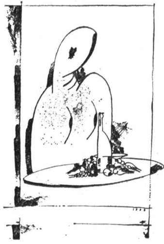
Георгий Франгуэлин. «Натюрморт», Автолитография.

В рамках фестиваля «Открытие сезона» прошла большая выставка автолитографии, открытая объединением «Московская палатра».