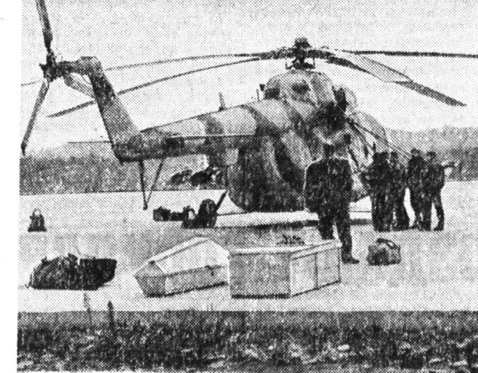
Беженцы в Адлерском аэропорту.

БОЛЕЕ 100 человек в час беженцы из Абхазии — грузины, армяне, русские, эстонцы, объединенные общим страхом, в первый день «агрессивной операции» переходили российскую границу в Адлере. Грузинские мужчины, продав жён и детей, возвращались воевать. Старик, незаметно уйдя из зоны, перенес в мирную зону часть своего имущества, лишь назад стечерь до. Администрация Сочи предоставила в распоряжение беженцев турбазы — 400 рублей в сутки с человека, включая детей. Не у всех оказалось с собой столько денег. Для них допотопились улочки, здесь ели, спали, пили скот, который тоже перешел границу. Жизнь людей превратилась в мучительные часы ожидания: кто-кого? Абхазы заняли Гагры, потеряв в бою 28 человек. Поблизости мирное население во время войны не учитывалось. Чуть в стороне от военных действий грузинские и абхазские женщины собирали на одной плантации чай и, только услышав об убийстве, раскисли в разные стороны.