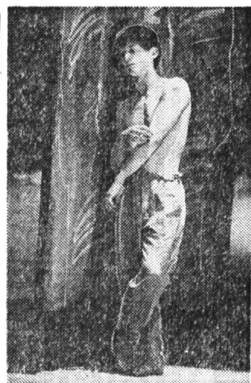
«Теорема» Дж. Баттистелли. Франсуа Тестори.

Еще один спектакль биеннале хотел казаться как можно ме-