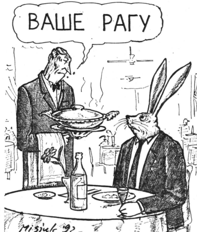
Рисунок Вадима Мисюка.