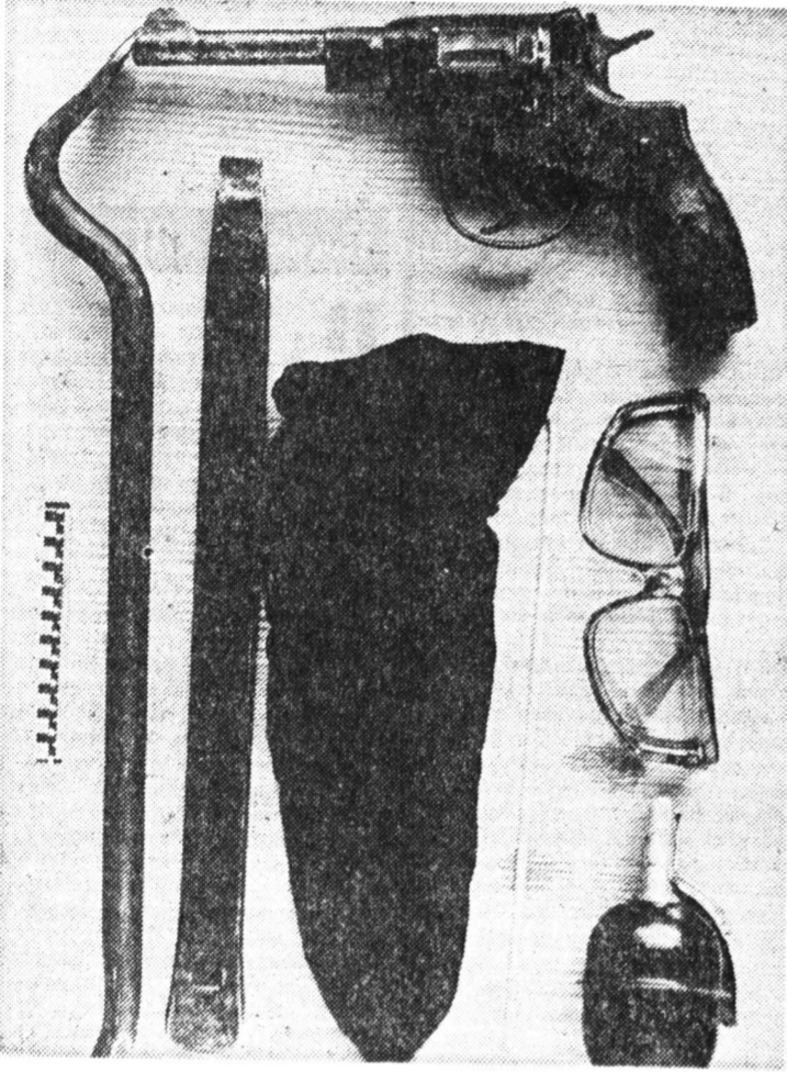
«Рабочий инструмент» бандита.

За полночь сыщики сами поднялись в означенную квартиру. Внутри их встретила шумная цыганская семья. 32-летний хозяин оказался человеком импульсивным и при слове «милиция» попытался прыгнуть на свою кровать. Когда же на его руках защекнулись наручники и он успокоился, сыщики нашли объяснение столь стран-