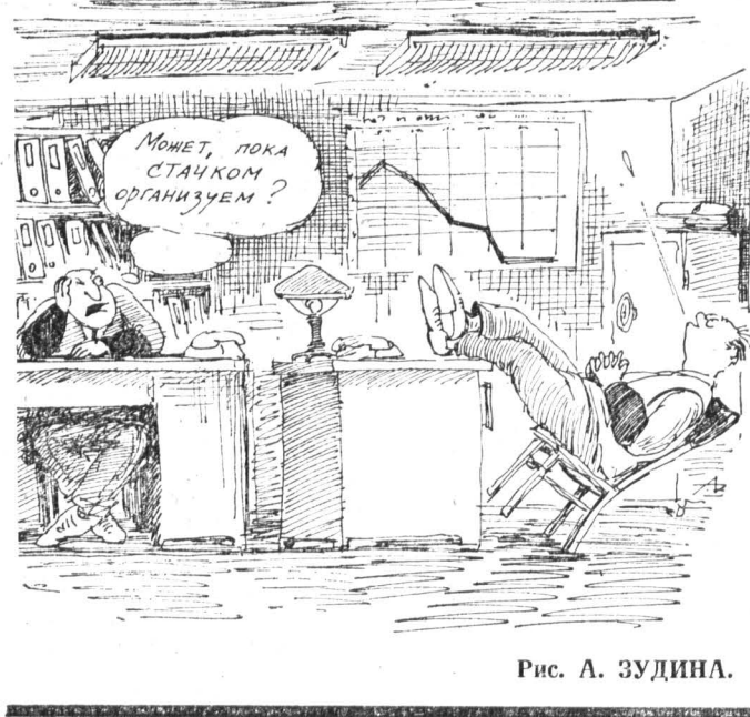
Рис. А. ЗУДИНА.