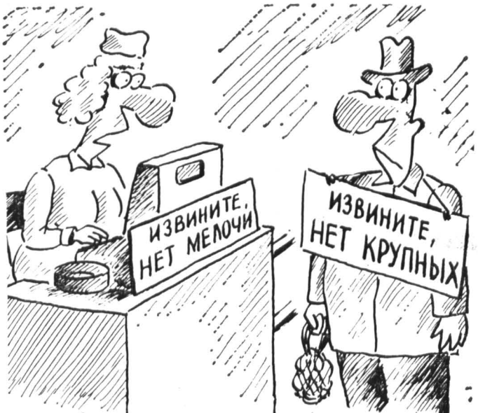
Рис. В. АДАМОВИЧА.