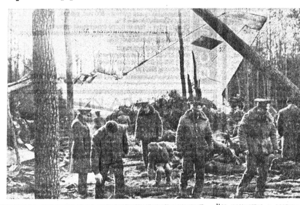
Сергей ЦИКОРА, «Известия»

Трагедия произошла в небе над Киевщиной. Во время испытательного полета разбился гигантский самолет Ан-124 «Руслан» КБ имени О. Антонова.