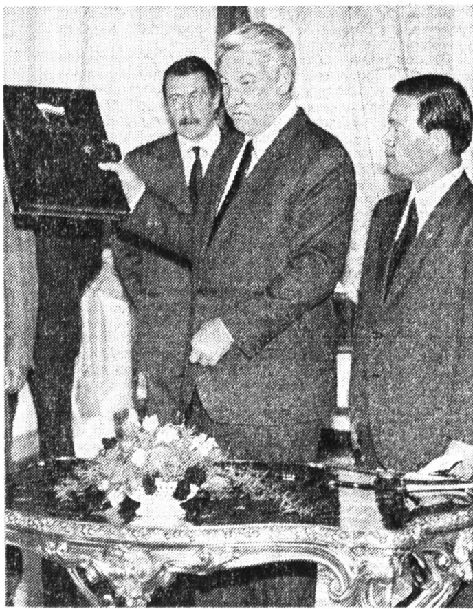
Во время передачи материалов южнокорейской делегации.

В пакетах, которые передал президент России, — 12 документов: расшифровка «черного ящика»; радиоброшена экипажа южнокорейского самолета с другими самолетами, находившимися в воздухе, и со службами управления воздушным движением; содержание магнитной записи бортового речевого регистра-