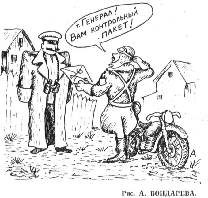
Рис. А. БОНДАРЕВА.