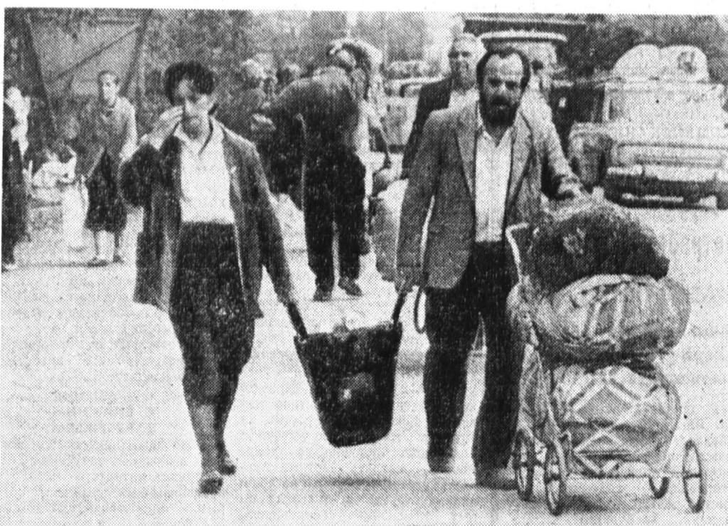
Беженцы из Абхазии на территории России.

12 октября состоялся теле- фонный разговор между прези- дентом России Борисом Ельци- ным и Эдуардом Шеварднадзе. Президент России поздравил Шеварднадзе «с единодушным избранием его на пост предсе- дателя парламента Грузии и по- бедой сторонников демократи- ческого курса в республике». Шеварднадзе и Ельцин услови- лись, что 12 октября в Моск- ве встретятся руководители министерств иностранных дел обоих государств и попытаются подготовить документ для под- писания на встрече в вехах. ИТАР — ТАСС.