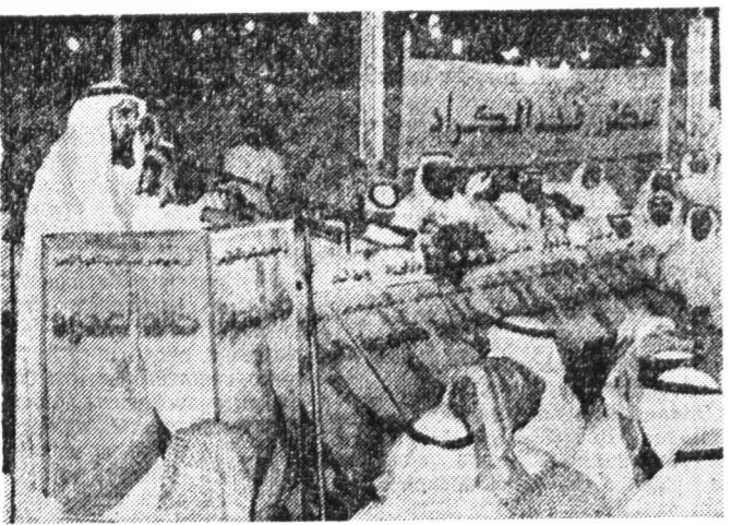
В понедельник в Кувейте прошли выборы в Национальный совет — парламент страны. На снимке из газеты «Файнаш таймс»: один из кандидатов в парламент выступает перед избирателями.

В Индии созданы силы «быстрого реагирования» для пресечения столкновений между различными религиозными общинами, которые приобретают в стране все более ожесточенный характер. Первый батальон сформирован на базе существующих подразделений центральной резервной полиции. На его вооружение последние «доставляют» полицейской мысли: слезоточивые газы, резиновые палки и электрошоковые дубинки.