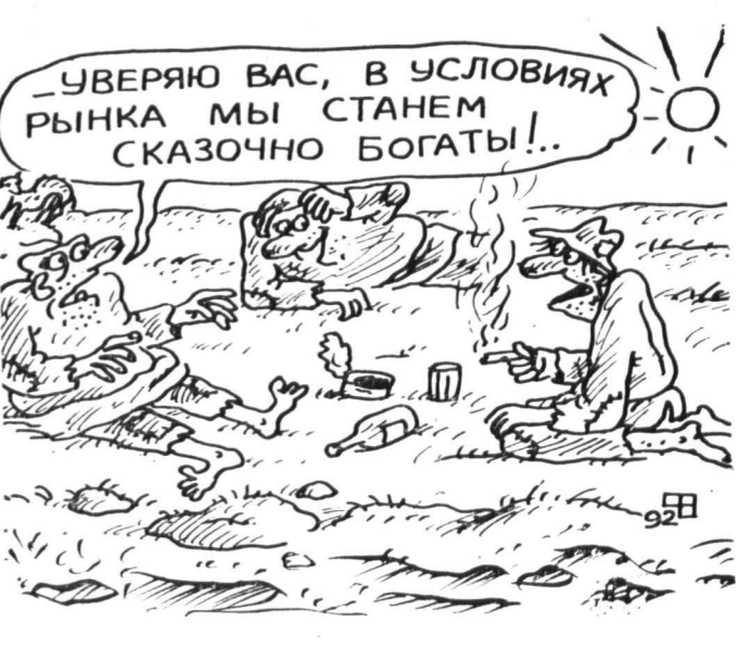
Рис. В. ФЕДОРОВА.

Валерий МИРОЛЕВИЧ (Воронеж), «Известия».