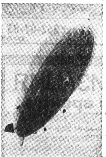
Воздушные корабли - Цепелины стали во всем мире синонимом техники высшего класса.

А что стало с "Люфтишиффау ГмбХ"? Из нее и было образовано "Цепелин-Металлверке ГмбХ" во Фридрихсхагене. Опыт создания воздушных судов сегодня является основой для новой, направленной в будущее продукции. Это, например, специальные антенны для аэродромов, установки направленной связи и радарные системы, алюминиевые