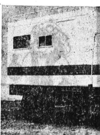
"Цепелин Системтехник" в Оффенбурге (Южная Германия) является специалистом по мобильным системам, как эта полностью оборудованная шельтер-мастерская на базе грузового автомобиля "Унико".

28 сотрудников основного предприятия, ведущие разработчики, проектирование и междугородный сбыт, совместно с предприятиями-изготовителями во Фридрихсхагене и Кельне могут гордиться множеством оригинальных решений весьма сложных задач с использованием наших шель-