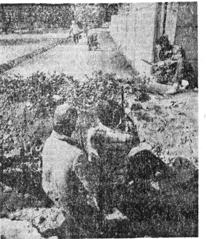
Один из многочисленных постов сил «самообороны» в Курган-Тюбе.