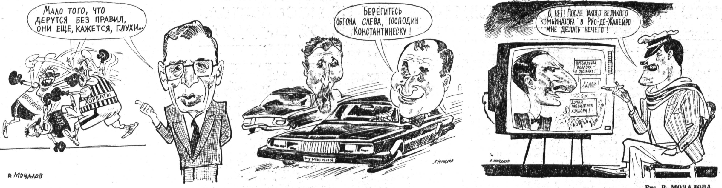
Рис. В. МОЧАЛОВ.