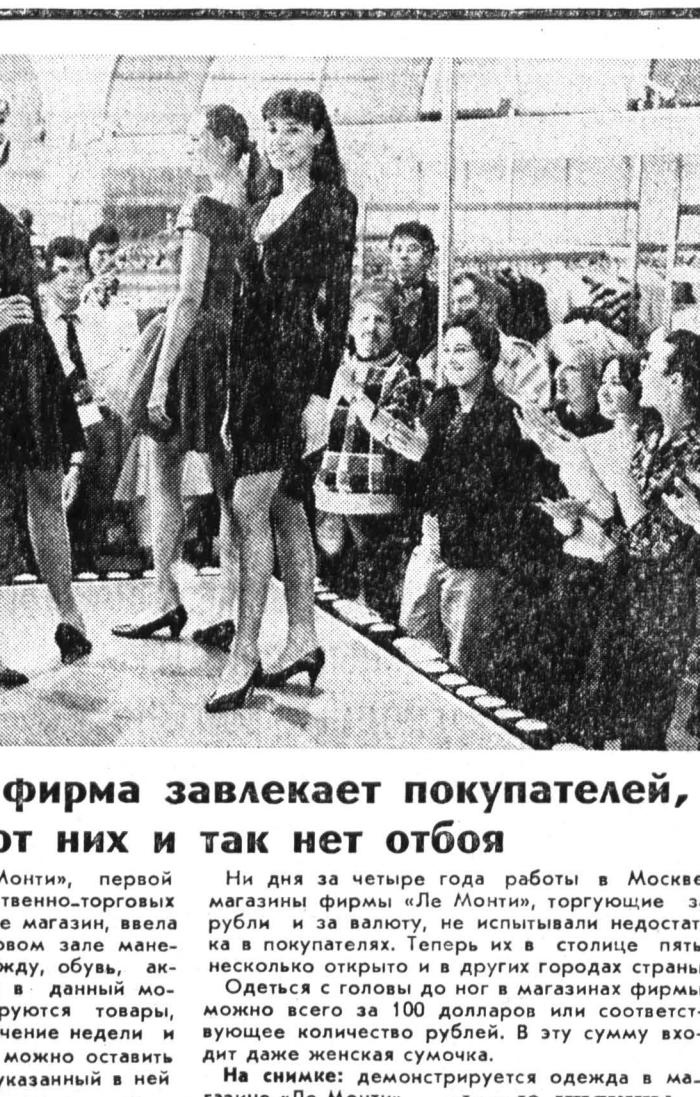
На снимке: демонстрируется одежда в магазине «Ле Монти».