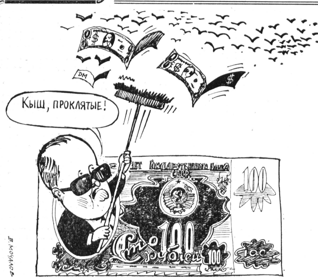
Рис. В. МОЧАЛОВА.