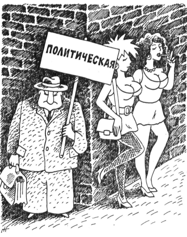
Рис. Г. НАЗАРОВА.