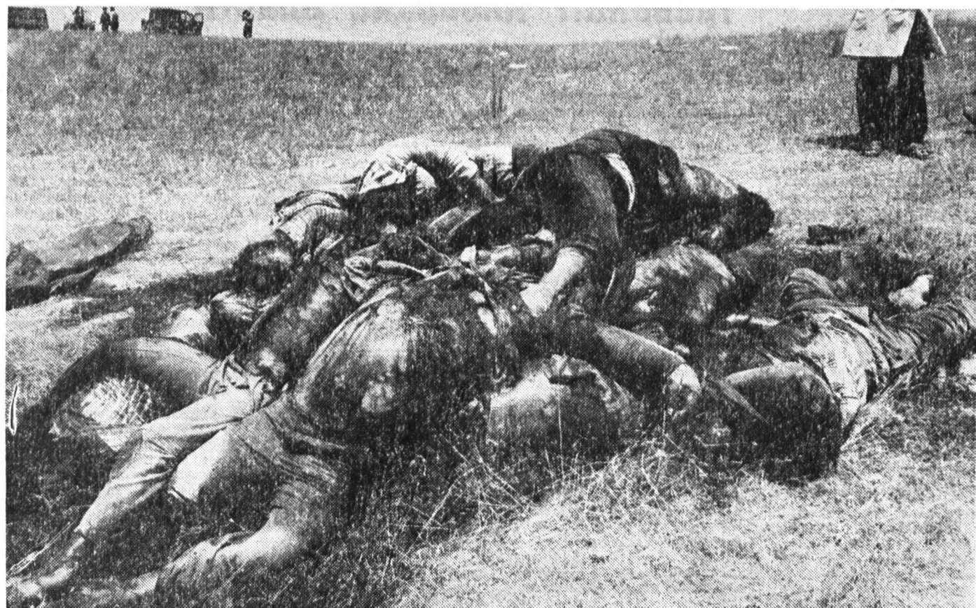
Курган-Тюбе, жертвы террора.

Специальные корреспонденты «Известий» Вадим Белых и Николай Бурбыга передают из Таджикистана