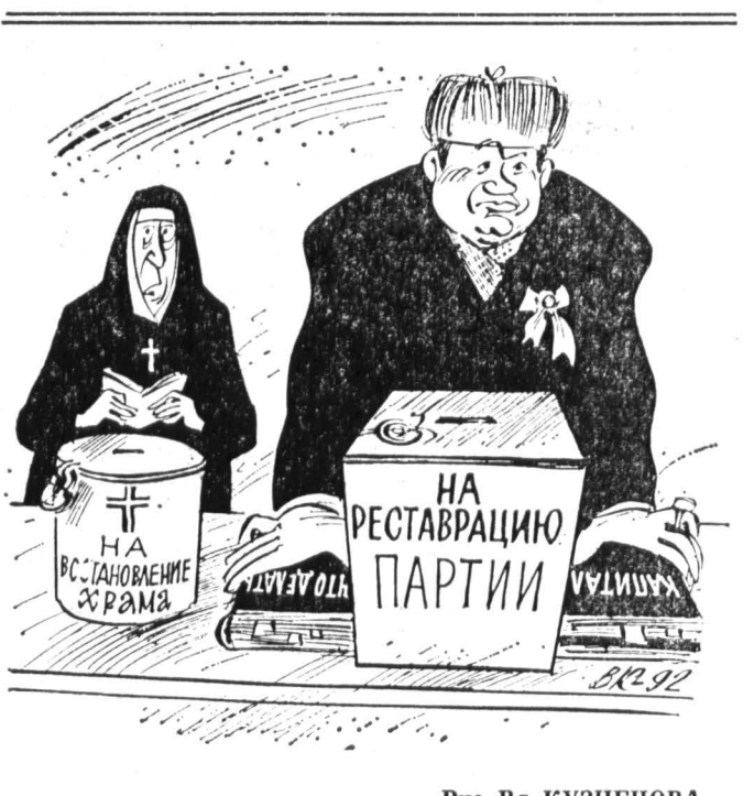
Рис. Вл. КУЗНЕЦОВА.