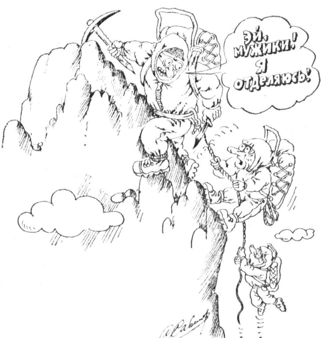
Рис. С. САВИЛОВА.