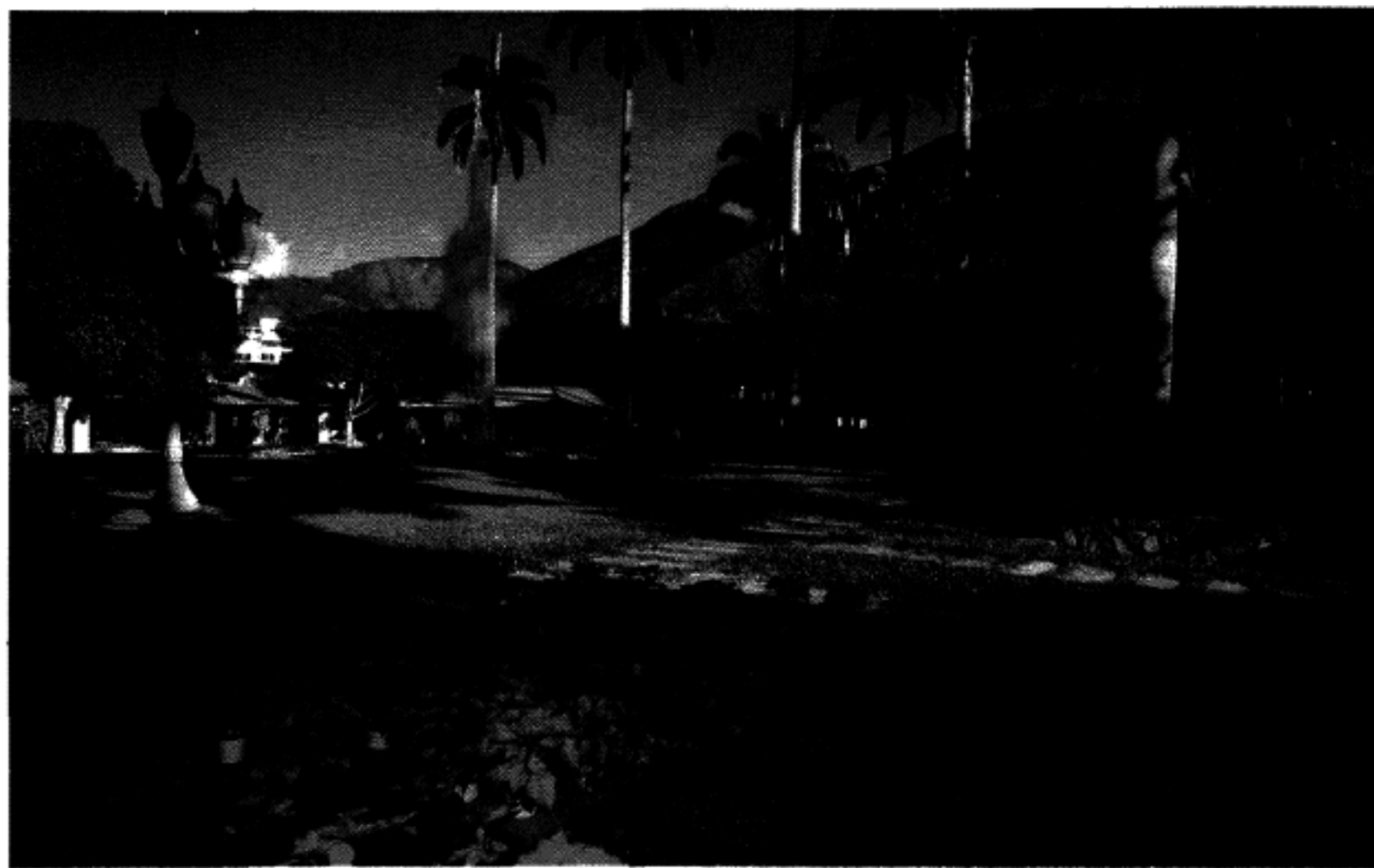
Jardín de "LA CASONA"

50 Al final de un quinquenio difícil, reafirmando nuestra confianza en el porvenir de Venezuela, para cuyo pueblo invocamos - como lo hace nuestra Constitución - la protección de Dios Todopoderoso, deseamos a todos nuestros Compatriotas, amigos y relacionados, unas Navidades muy placenteras y un Feliz Año 1999.