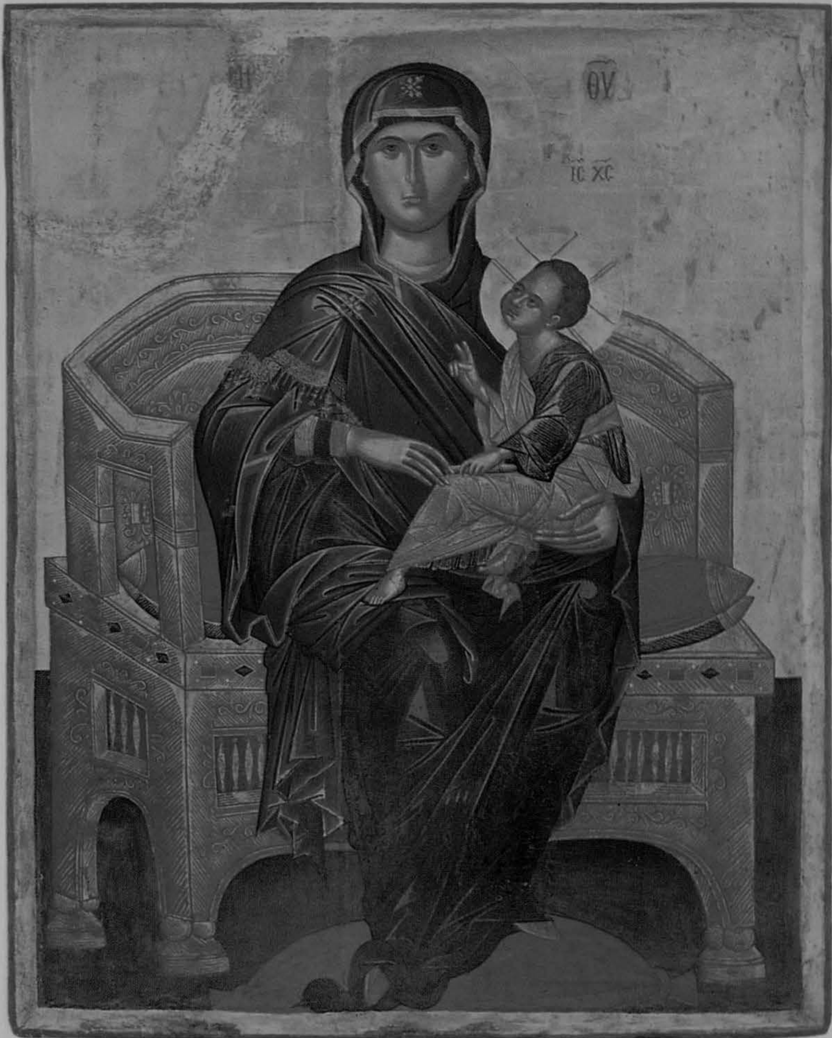
Virgin and Child, Church of Christ Antiphonitis. Kalograea. End of the 15th century.