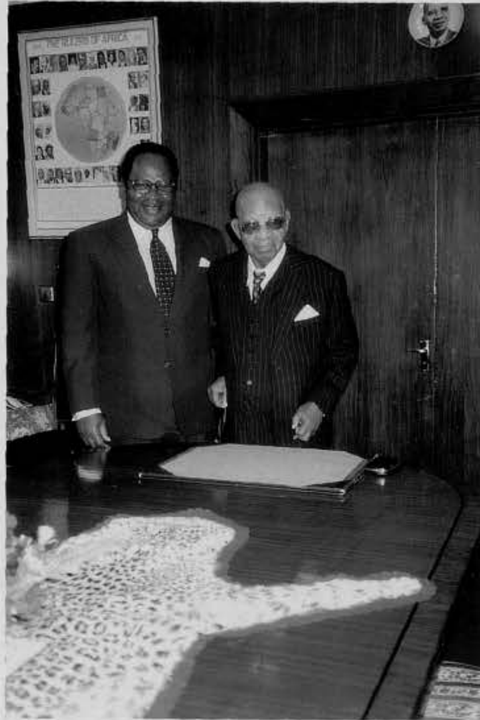
His Excellency Dr. Bakili Muluzi (Left), President of the Republic of Malawi with the Former President of the Republic of Malawi, Dr. H. Kamuzu Banda (Right), pictured at Mudi House on 19 th August, 1997 during their goodwill meeting.