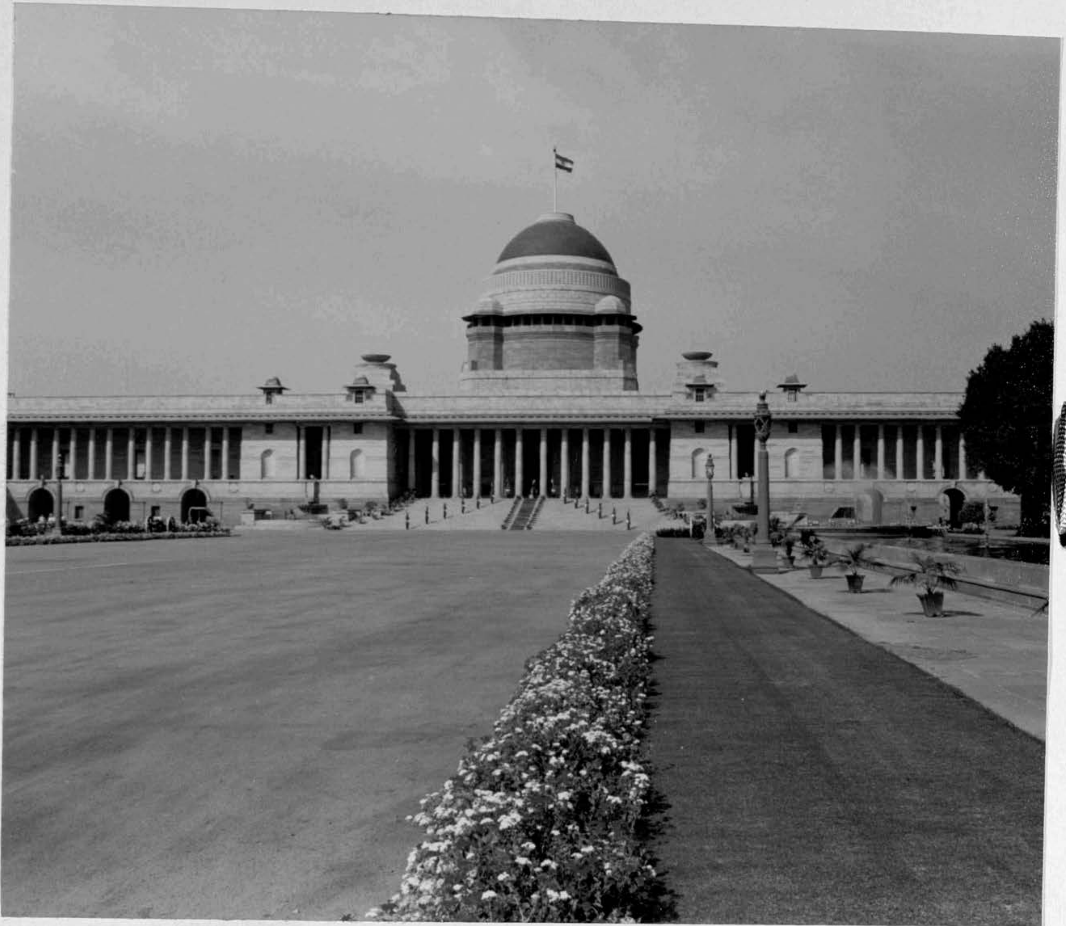
राष्ट्रपति भवन / Rashtrapati Bhavan