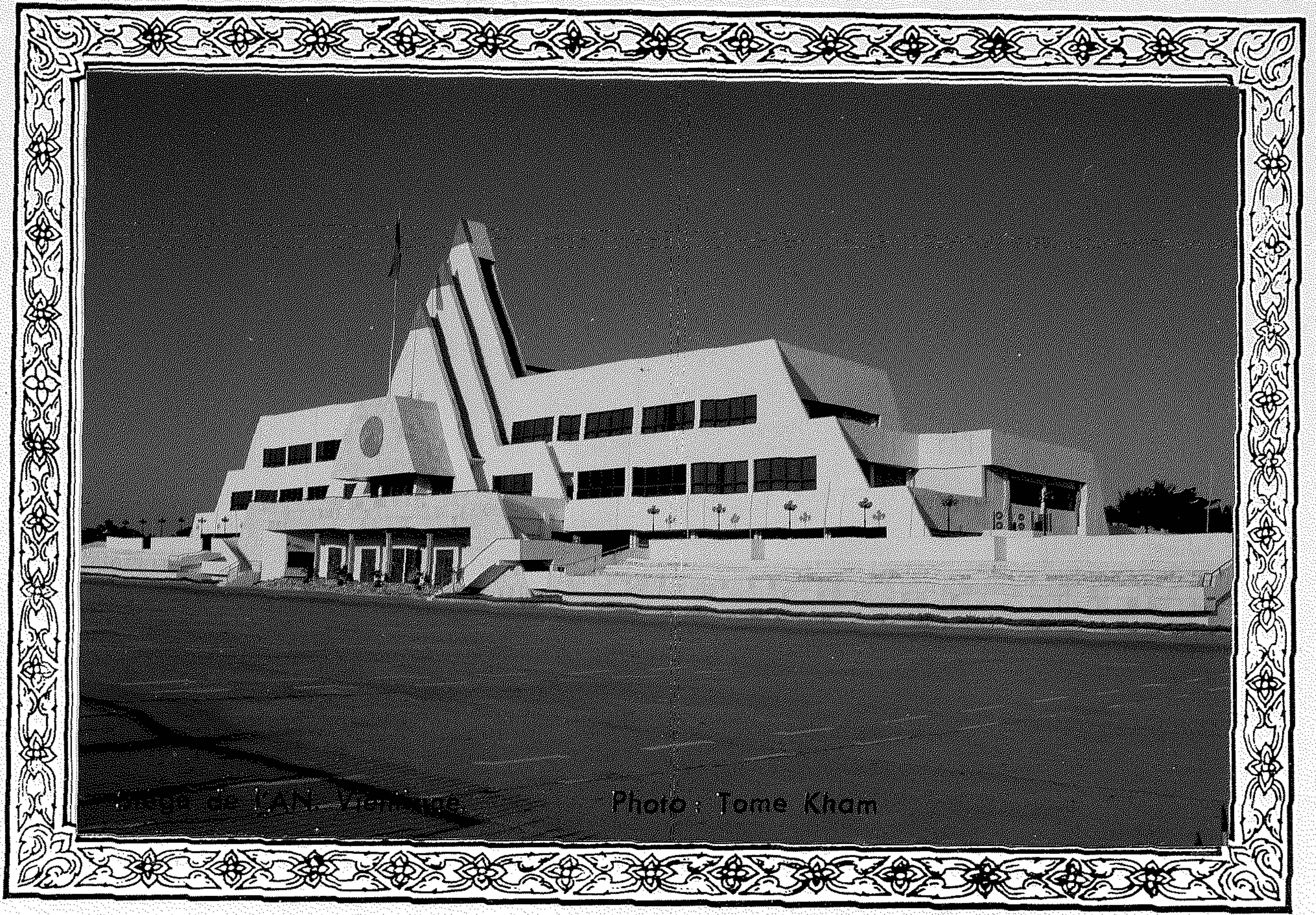
Palacio de LAN, Vietnam